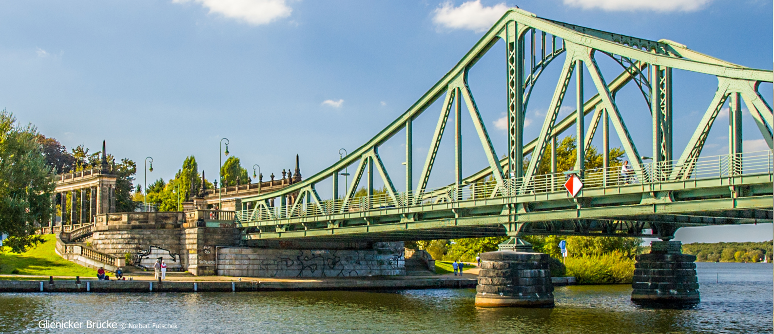
Glienicker Brücke